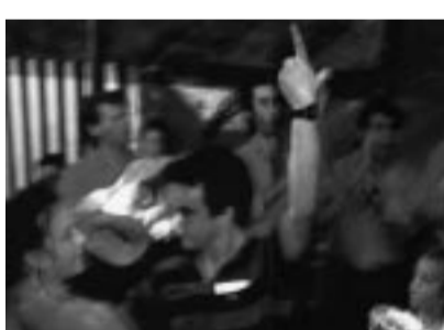
Morgana Disco Mondial