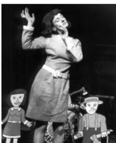
Hänsel und Gretel