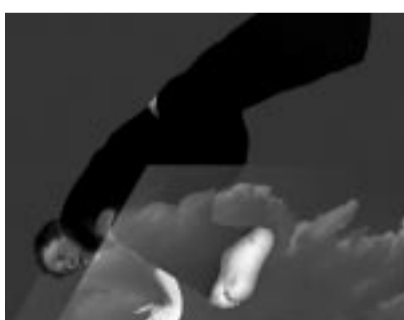
Hommes aux semelles de vent.