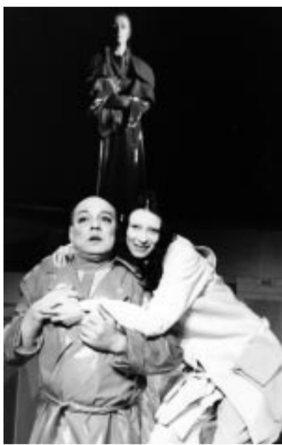
Theater Kanton Zürich: „Karlos“