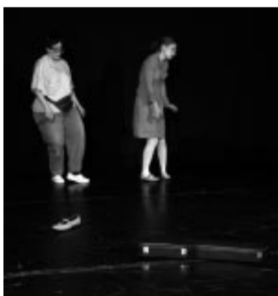
Theater Company Ilg: „Herr Albert schneit“