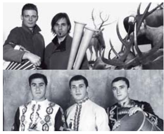
Duo Stimmhorn, Trio Emmanuel: „Stimmhorn meets Duduk“