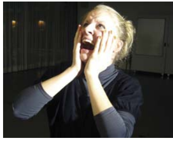
Junge Bühne Zürich: „Der wahre Inspektor Hound“