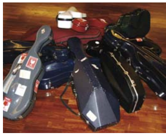
„12 Celli academici“