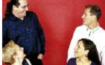
Ensemble æquator: „vis-à-vis“