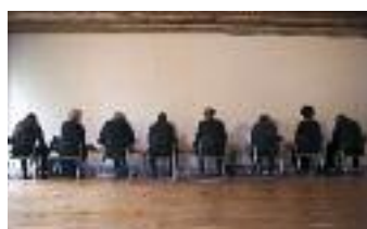
„Neue Horizonte Bern“