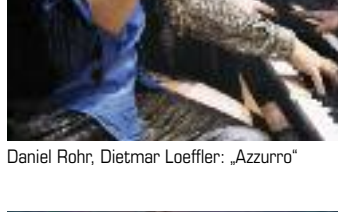
Arthur Lourié: „La Naissance de Beauté“