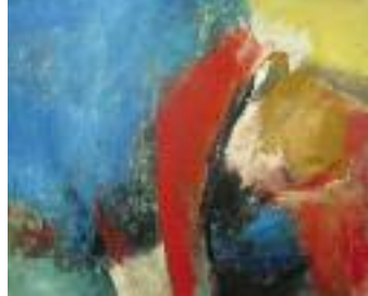
Fred Glücksmann: „abstrakte Landschaften“ um die Ecke“, 54 x 65 cm